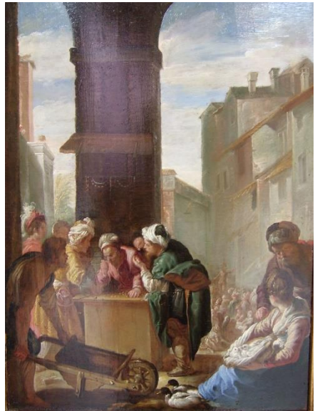
Das Gleichnis von der köstlichen Perle von Domenico Fetti

Wiederum ist es mit dem Himmelreich wie mit einem Netz, das ins Meer ausgeworfen wurde und in dem sich Fische aller Art fingen. Als es voll war, zogen es die Fischer ans Ufer; sie setzten sich, sammelten die guten Fische in Körbe, die schlechten aber warfen sie weg. So wird es auch bei dem Ende der Welt sein: Die Engel werden kommen und die Bösen aus