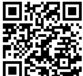
Kreuzweg an der Ems