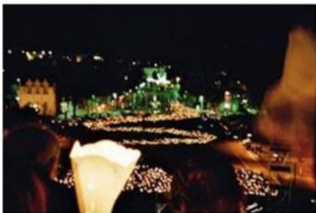
Die Lichterprozession am Abend in Lourdes

vor der Grotte sowie die beeindruckende Lichterprozession sind Höhepunkte der jeweiligen Wallfahrt und Pilgerreise.