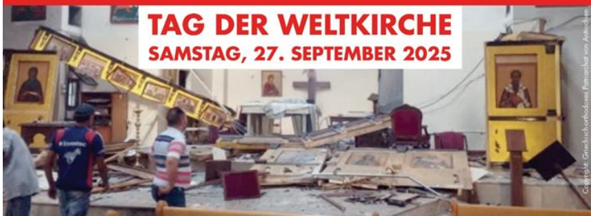
Die Mari-Elias-Kirche in Damaskus (Syrien) nach einem islamistischen Anschlag am 22. Juni 2025