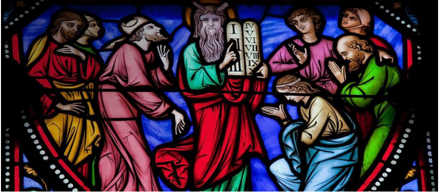
Kirchenfenster mit Moses und den zehn Geboten.

Als die Pharisäer hörten, dass Jesus die Sadduzäer zum Schweigen gebracht hatte, kamen sie am selben Ort zusammen. Einer von ihnen, ein Gesetzeslehrer, wollte ihn versuchen und fragte ihn: Meister, welches Gebot im Gesetz ist das wichtigste?